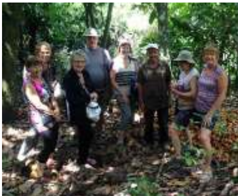
Visite d'une plantation de chocolat