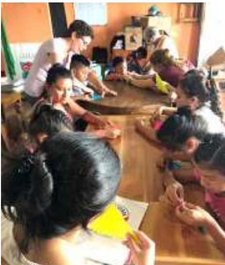
Atelier avec les enfants

Nous sommes maintenant prêts à repartir. Nous vous invitons.