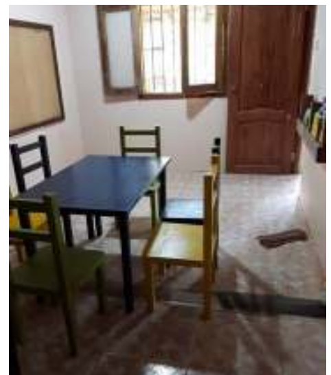
Projet réalisé à Clara Luna, salle pour les enfants