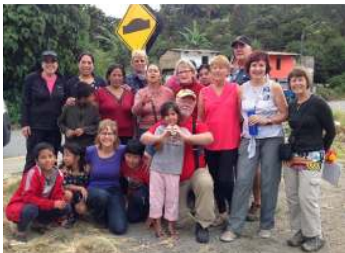
Familles d'accueil des bénévoles de Huyro