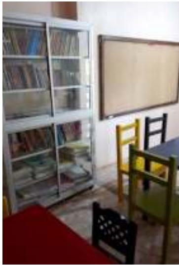
Projet d'aménagement d'une classe à Puerto Lopez

Au Hogar de Ancianos de Boaco, des fonds de 3500$ US ont été alloués en septembre 2019 pour l'achat et l'installation d'une laveuse à linge industrielle, ce qui comprend également une remise à niveau du système électrique. Un montant de 700$ US a aussi été alloué à la Casa Búho de Machalilla en Équateur, pour l'achat de livres pour la petite bibliothèque opérée par l'organisme.