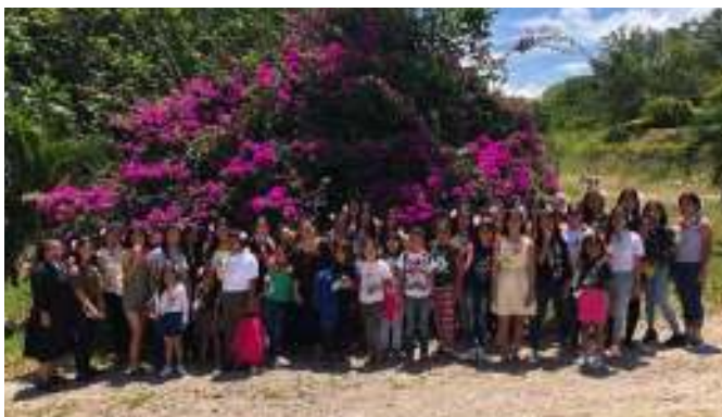
Boursières au Honduras

Également, SOLIDARITÉ SUD mise sur l'éducation pour aider des jeunes à sortir du cycle de la pauvreté.