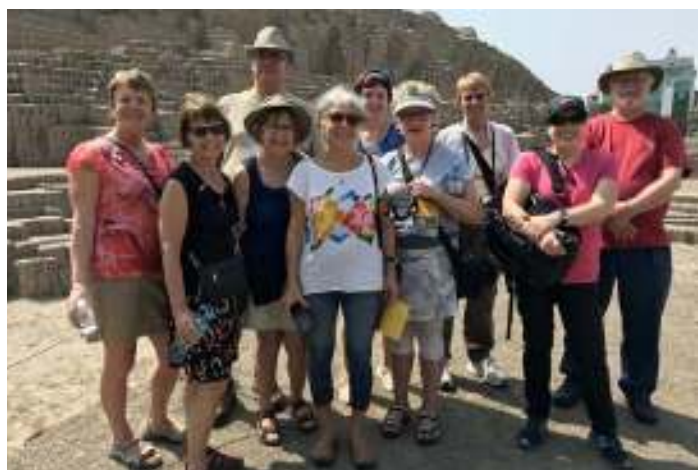
Cohorte 2019 à Lima

Le groupe était composé de neuf bénévoles qui ont travaillé dans différentes institutions du district de Huayopata et dont la capitale est Huyro.