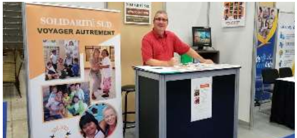
Le kiosque de SOLIDARITÉ SUD au Salon FADOQ 50+ Québec et Chaudière-Appalaches.