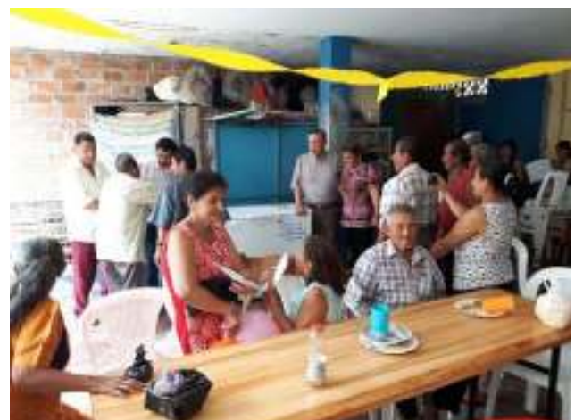
Comedor ou soupe populaire