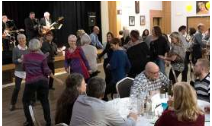
Le groupe de musiciens « Les Challengers » ont joué les bons vieux succès des années 60-70.