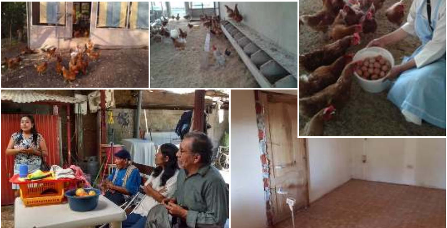
Multiplés aménagements à l'Albergue de los Ancianos de Santa Teresa au Pérou