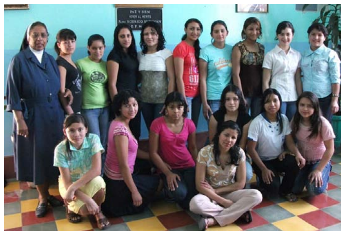
Groupe d'étudiantes bénéficiaires des bourses d'études

En 2011 nous avons pu consolider les projets en cours grâce aux dons des particuliers pour les bourses et de deux fondations pour les projets de développement, soit Les amis des enfants du Monde et une autre fondation qui désire garder l'anonymat. Notre organisme est très reconnaissant envers tous ses généreux donateurs.